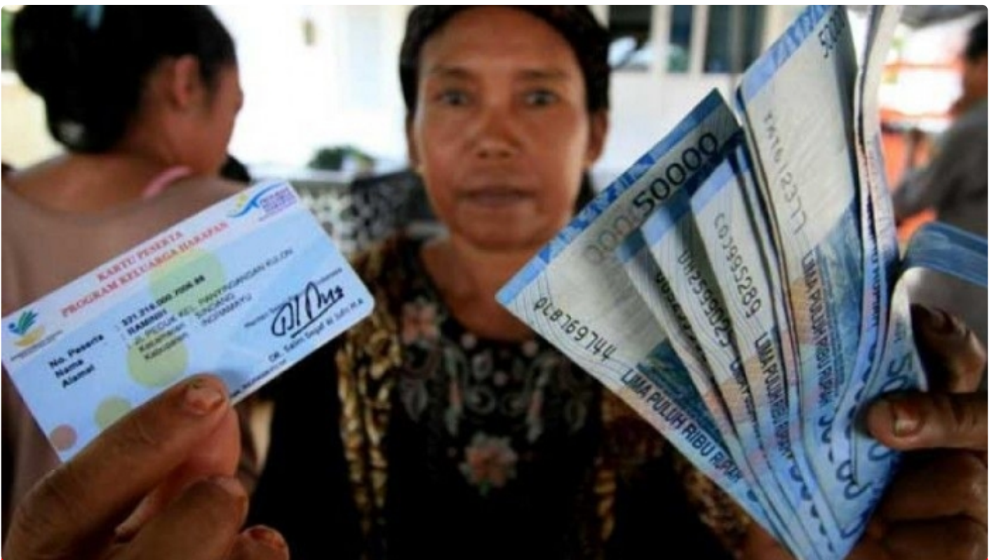
Ilustrasi Pemberian Bantuan Langsung Tunai (BLT).

SURABAYA – Harga bahan bakar minyak (BBM) bersubsidi dan non-subsidi resmi mengalami kenaikan pada Sabtu (3/9). Hal tersebut langsung diumumkan oleh Presiden Joko Widodo di Istana Merdeka, Jakarta. Kenaikan komoditas tersebut memicu gelombang protes yang masif dari berbagai kalangan masyarakat. Demo dan seruan aksi tidak berhenti digelar di berbagai tempat.